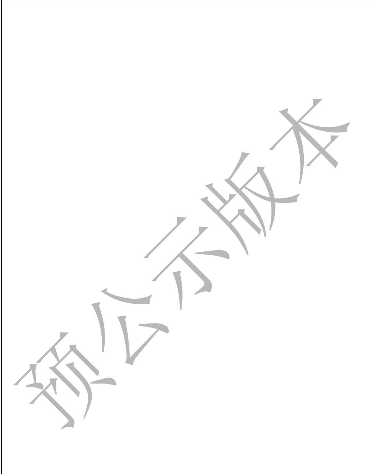
表8 项目管理班子配备情况辅助说明资料

注：1、辅助说明资料主要包括管理班子机构设置、职责分工、有关复印证明资料以及投标人认为有必要提供的资料。辅助说明资料格式不做统一规定，由投标人自行设计。 2、项目管理班子配备情况辅助说明资料另附。